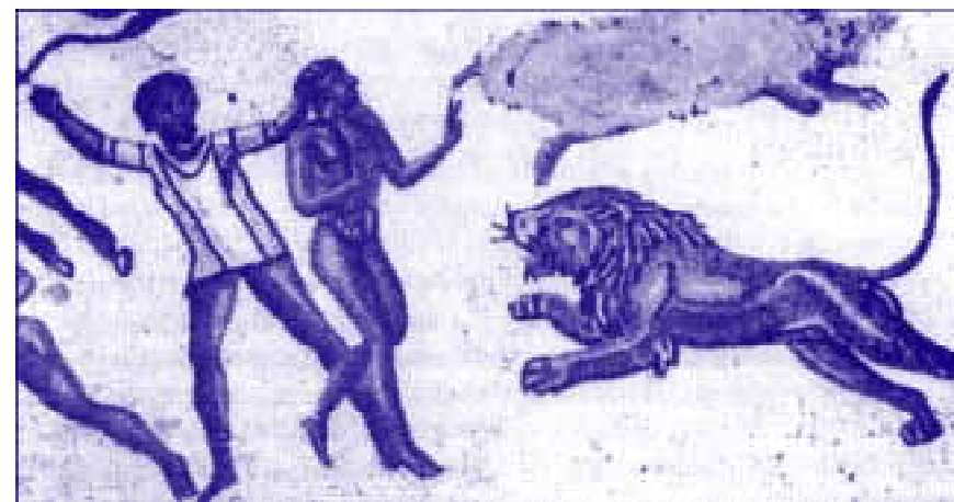
Люди, приговоренные к растерзанию дикими зверями (мозаика, конец I в.)